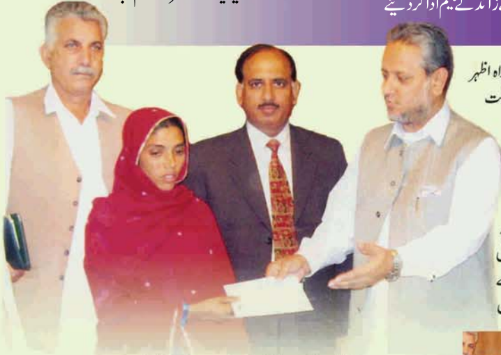
وزیراعظم آزاد کشمیر سردار عتیق احمد خان ایک قانون کو ڈیجھ کلیم چیک دے رہے ہیں، اس موقع پر جناب اظہر حسین اور سیکرٹری جناب متبول کیانی بھی موجود ہیں

اسٹیٹ لائف انشورنس کارپوریشن نے ان علاقوں میں جہاں 2005ء میں زلزلہ کی تباہ کاریوں سے زندگی اجیرن بن گئی تھی، متاثرین کی بحالی کے لیے قابل قدر خدمات انجام دیں۔ اس ضمن میں ریجنل چیف راجہ ظفر علی شان نے جناب چیئرمین کی خصوصی ہدایات کی روشنی میں اپنی فیلڈ فورس میں ”خدمت میں عظمت ہے“ کا جذبہ بیدار کر کے خصوصی ٹاسک سونپا کہ متاثرہ بیمہ داروں اور ان کے لواحقین سے قریبی رابطہ رکھیں اور ڈیجھ کلیم کی ادائیگی میں کوئی کوتاہی نہ