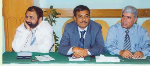
سیکٹر ہیڈ زونل سماعت ہیں