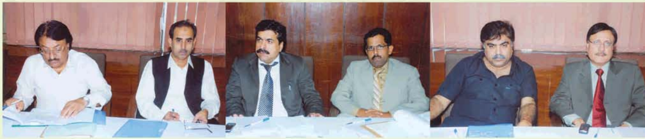
زونل ہیڈ سدرن ریجن بریفنگ کے دوران

انہوں نے یقین دلایا کہ وہ مارکیٹنگ فورس اور ایریا مینجر کے مسائل کے فوری حل اور ان کے تشخص کو اجاگر کرنے کے لیے کوئی دقیقہ فروگذاشت نہیں کریں گے۔ بعد ازاں تمام شرکاء کو افطار ڈنر پر مدعو کیا گیا۔